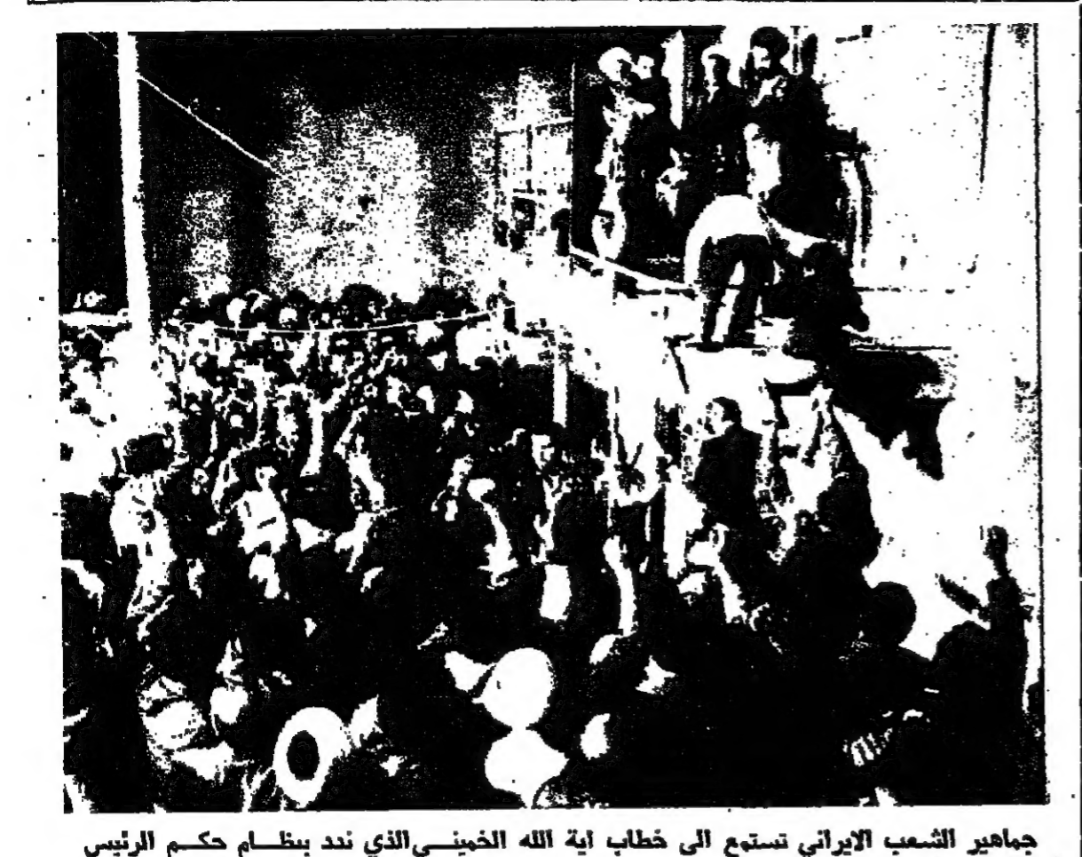
جماهير الشعب الالمانى تستمع الى خطاب آية الله الخميني الذي ندد بنظام حكم الرئيس العراقي صدام حسين